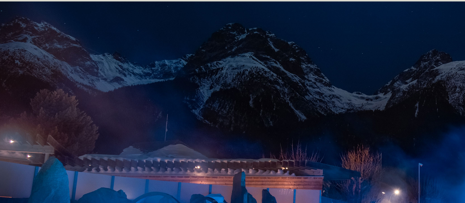
Panorama cuntrada da bogns dadoura / Panorama Bäderlandschaft aussen

Duos evenimaints han dat la taimpra a l'on 2018, il settavel on da gestiun da la BES SA cul acziunariat schlargià: la restructuraziun da las gardarobas e la festa da giubileum 25 ons Bogn Engiadina da prümavaira.