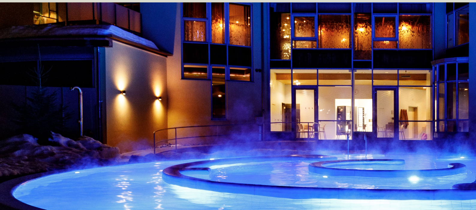
Cuntrada da bogns dadoura / Bäderlandschaft aussen

werden. Das Bogn Engiadina ist im Tarifvergleich mit gleichartigen Anlagen eines der günstigeren Bäder der Schweiz. Wir sind überzeugt, dass das Angebot des Bogn Engiadina nach wie vor über ein ausgezeichnetes Preis-/Leistungsverhältnis verfügt.