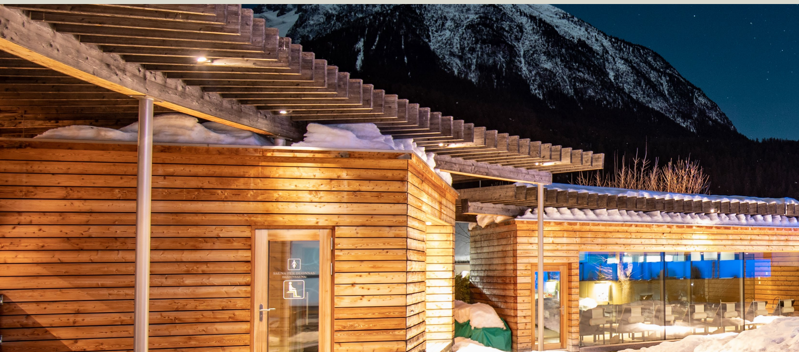
Cuntrada da saunas dadoura / Saunalandschaft aussen