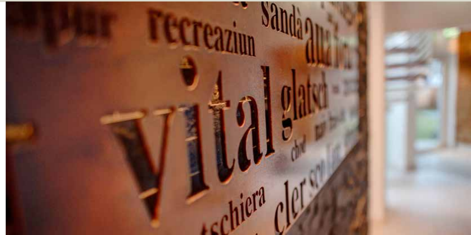
Entrada cuntrada da saunas / Eingang Saunalandschaft