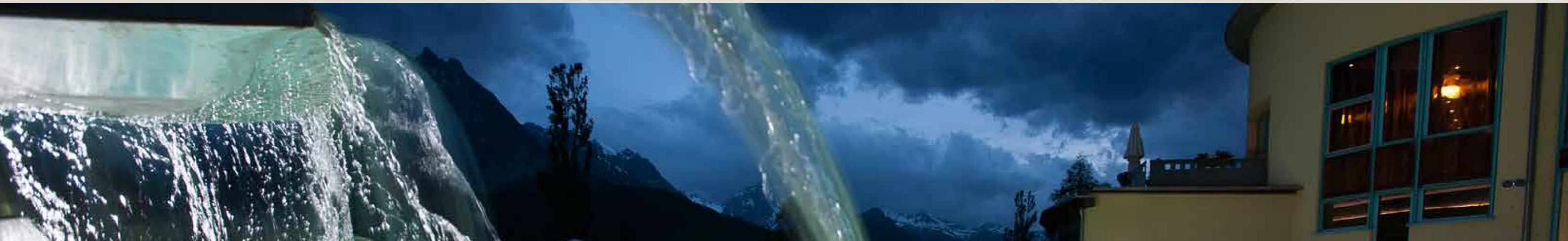
Panorama da saira illa cuntrada da bogns dadoura / Abendpanorama in der Bäderlandschaft aussen