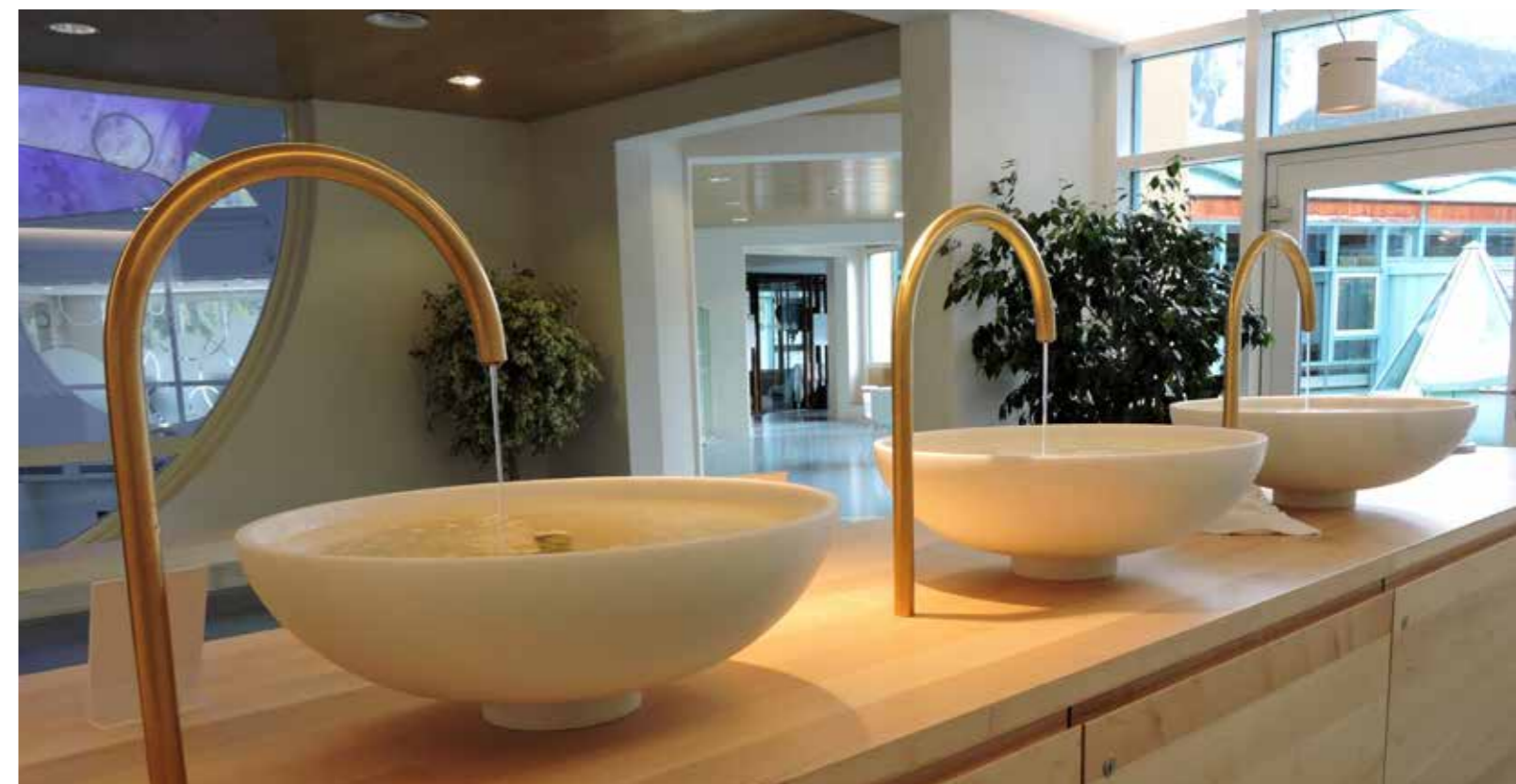
Entrada nouva cun chascha e büvetta / Neue Eingangshalle mit Kasse und Trinkbrunnen