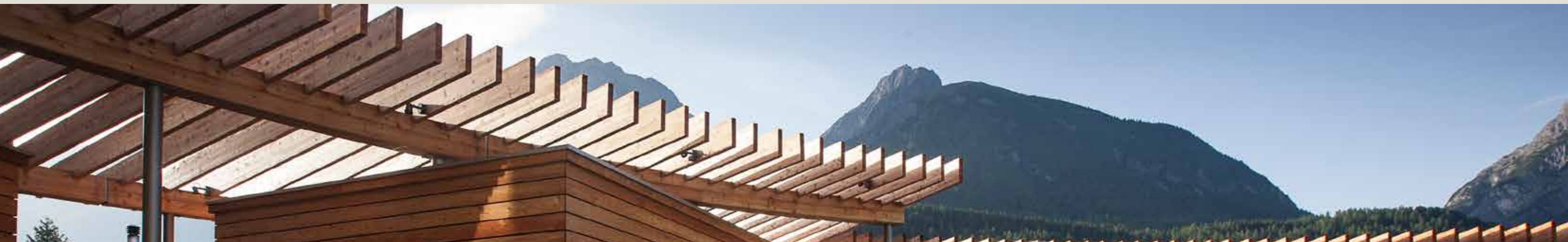
Panorama illa cuntrada da saunas dadoura / Panorama in der Saunalandschaft aussen