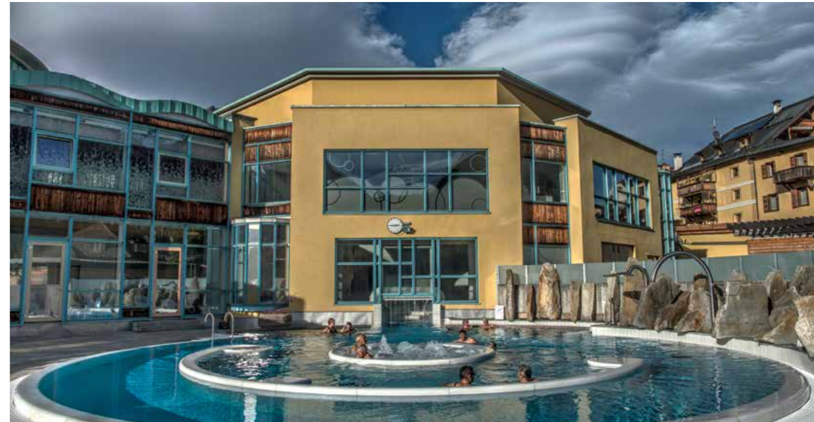
Cuntrada da bogns dadoura renovada / Renovierte Bäderlandschaft aussen